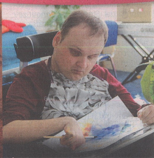
AKTIVAČNÍ CENTRUM JSME TADY